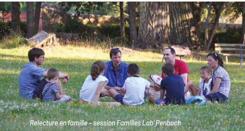
Relecture en famille – session Familles Lab' Penboch

Sûrement la vie familiale offre-t-elle bien des ressources encore pour nous conduire à nous-mêmes et, en même temps, nous ouvrir aux autres. Nous croyons que, cela s'exerce, s'apprend, se vérifie et séduque à l'école de l'Évangile.