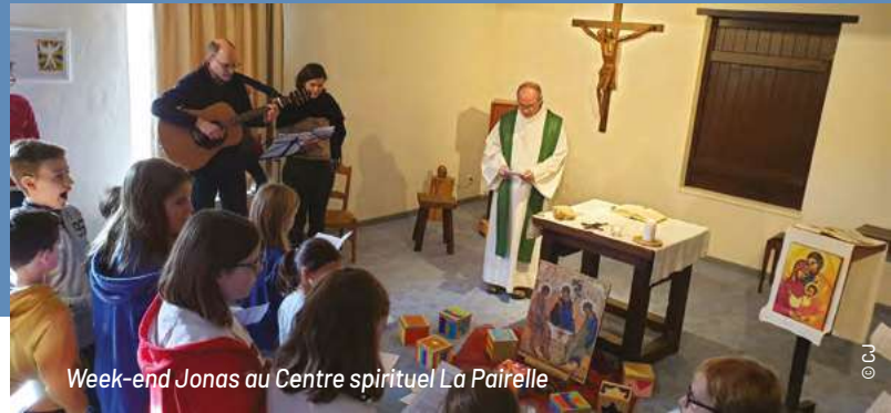
Week-end Jonas au Centre spirituel La Pairelle