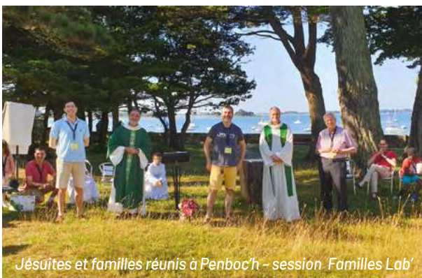
Jésuites et familles réunis à Penboc'h - session 'Families Lab'