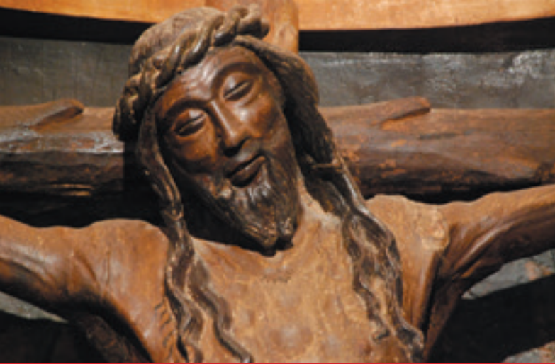
Christ souriant devant lequel saint François Xavier pria (Château de Javier, Espagne)