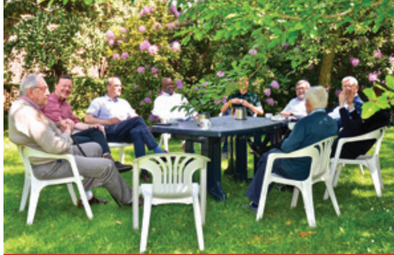
Quelques membres de la communauté Saint-Michel à Bruxelles