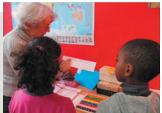
Soutien scolaire de jeunes défavorisés