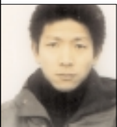
PAR HISASHI FUJITA

Inaugurée en 1968 par la publication du Milieu divin au pays du soleil levant, la traduction en japonais des œuvres complètes de Teilhard s'est poursuivie jusqu'en 1975.