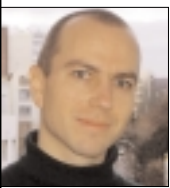
PAR PHILIPPE CHEVALLIER Jésuite

En 1923, c'est le premier d'une longue série de voyages en Chine : Teilhard sillonne le