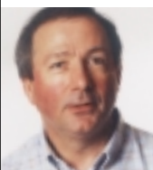
PAR JACQUES NIEUVIARTS Assomptionniste, bibliste.

ANALYSE. À Dieu qui lui demande où est Abel, Caïn répond par une autre question... Mais au fil des pages, la Bible le répète : oui, les hommes sont frères, oui, ils sont responsables les uns des autres. C'est ce qui fonde leur humanité, et l'oublier conduit à la violence et au meurtre.